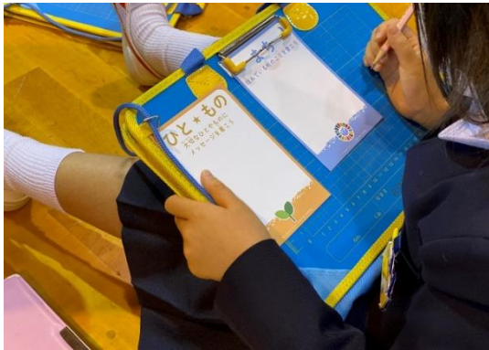
2枚のカードに思いを記入する子供たち